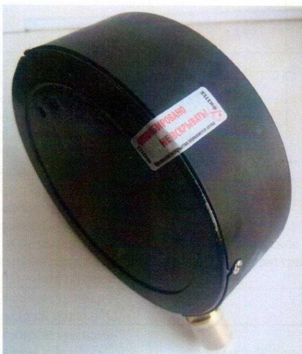
Рисунок 7 – Заводская пломбировка с помощью наклейки

Знак поверки наносится на место соединения корпуса с обечайкой, лицевую часть (стекло), либо на тыльную сторону прибора (по согласованию) в виде наклейки показано на рисунках 7 и 8.