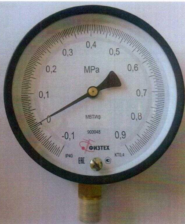
Рисунок 6 – МВТИф

Знак поверки наносится на место соединения корпуса с обечайкой, лицевую часть (стекло), либо на тыльную сторону прибора (по согласованию) в виде наклейки показано на рисунках 7 и 8.