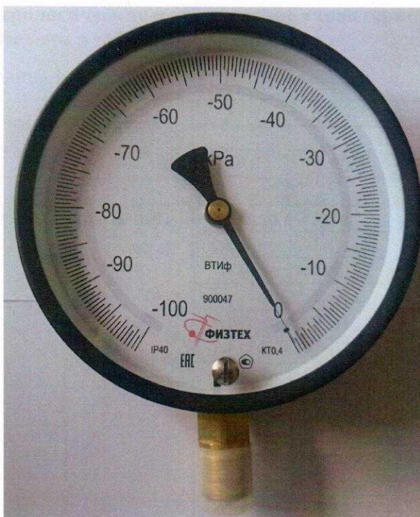
Рисунок 5 – ВТИф