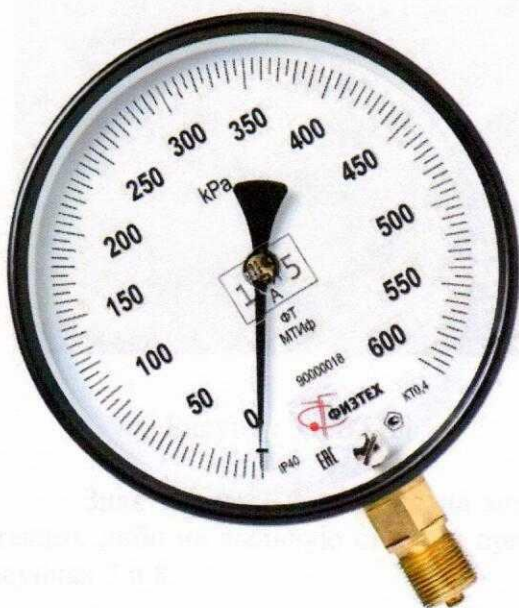
Рисунок 1 – МТФ

Общий вид различных модификаций приборов приведен на рисунках 1 - 6.