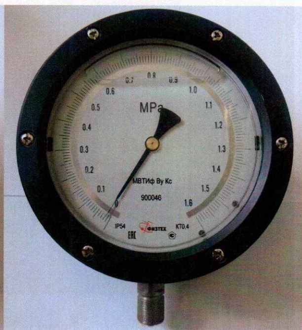
Рисунок 4 – МТФ Vy Кс