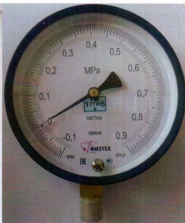
Рисунок 8 – Место нанесения знака поверки