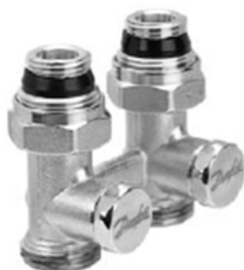
RLV-KS прямой с присоединением к отопительному прибору G ½ и G ¾