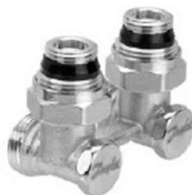
RLV-KS угловой с присоединением к отопительному прибору G ½ и G ¾