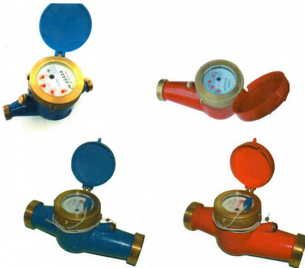
Рисунок 1 – Общий вид счётчиков холодной и горячей воды крыльчатых многоструйных МВС

Общий вид счётчиков представлен на рисунке 1.