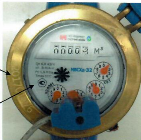
Рисунок 3 – Место нанесения знака утверждения типа и заводского номера на счётчики холодной и горячей воды крыльчатые многоструйные МВС