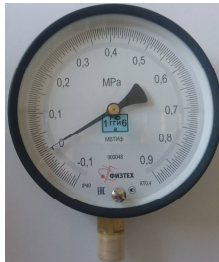
Рисунок 2 – Место нанесения знака поверки