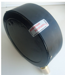
Рисунок 1 – Заводская пломбировка с помощью наклейки

3.5. Приборы соответствуют требованиям ГОСТ2405-88 и ТУ 4212-117-64115539-2016.